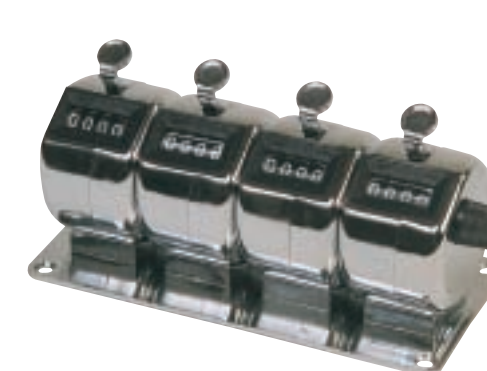
3026-4 Ganged desk tally